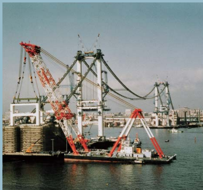
台場側 P39 架設