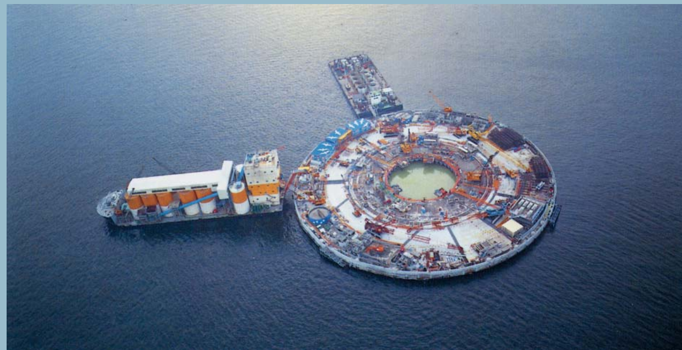
東京湾横断道路川崎人工島コンクリート打設