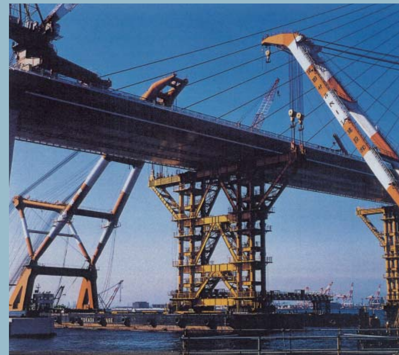
扇島側 ベント撤去