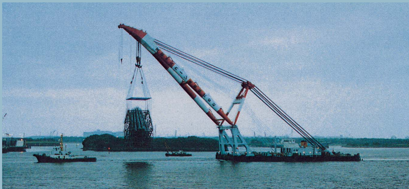
台場側 アンカーフレーム吊運撤去付 (横浜～台場)