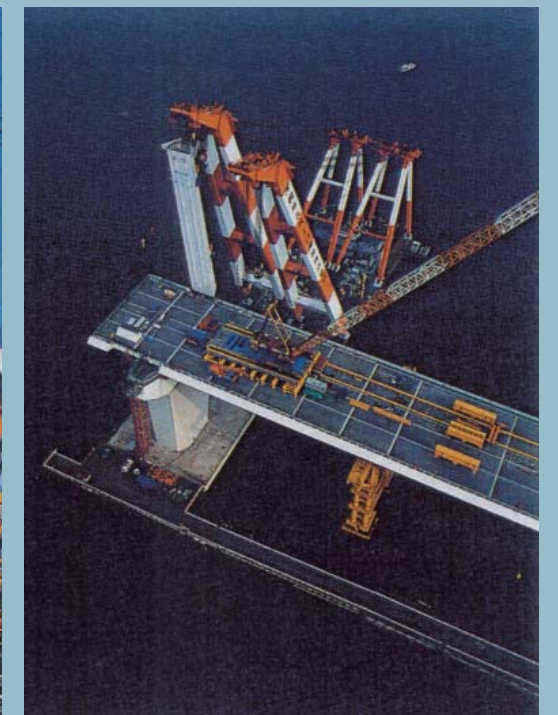
大黒側 主塔中段柱ブロック架設