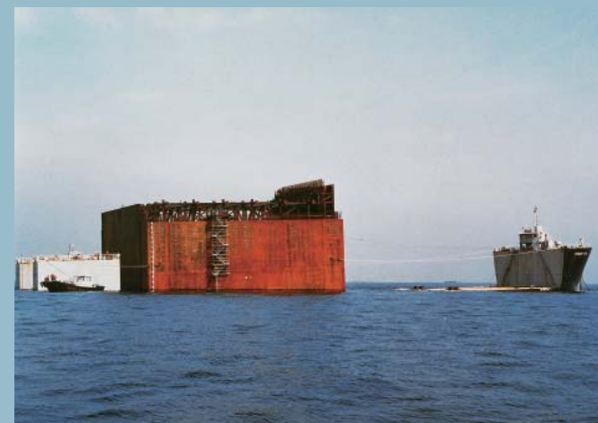
立抗鋼殻ケーソン台船輸送・着水作業