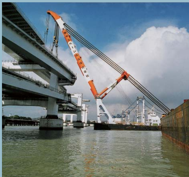
台場側側径間桁ブロック架設