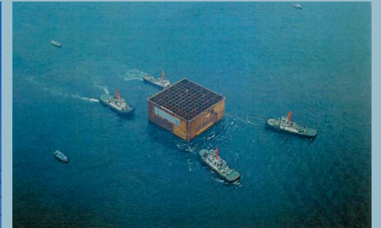
主塔ニューマチックケーソン曳航・据付