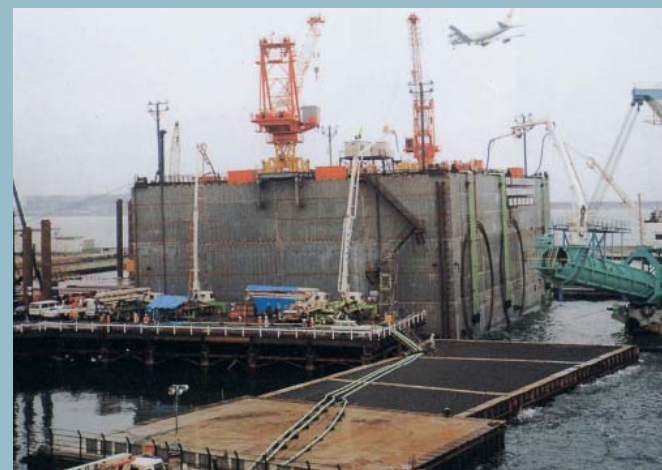
中ブロック浜出工事